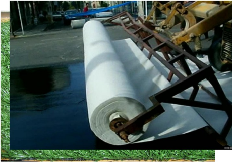
تقویت روکش آسفالت