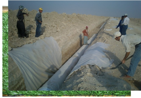
جلوگیری از شناور شدن لوله مفاظت از فوطه لوله