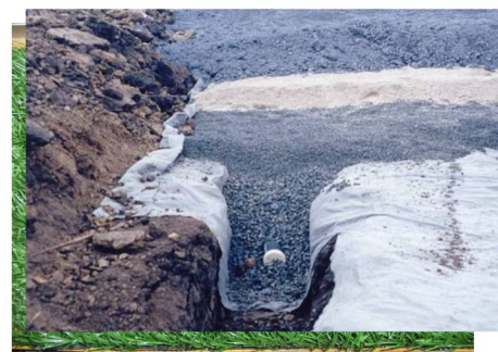
مماظت زهکش و فیلتراسیون