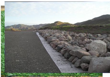
تمکیم و تثبیت بستر