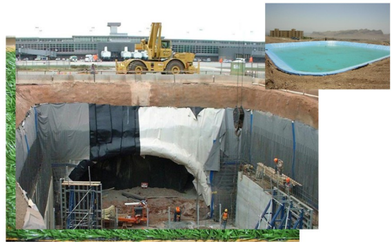
مماظت از ورق های ژئوممبران (تونل، سد، کانال)