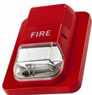
آژیر فلاشر سایز بزرگ

مدلهایی که در عکس های زیر نشان داده شده است هر دو در سیستمهای TC100 قابل استفاده هستند که مدل اول آژیر و دومی آژیر و فلاشر میباشد که همزمان با آلامر فلاشر نیز ایجاد میگردد.