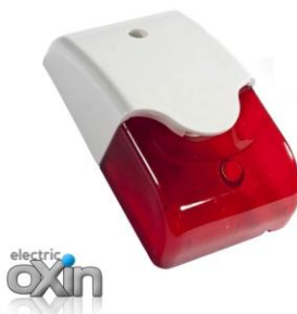
آژیر - فلاشر کوچک