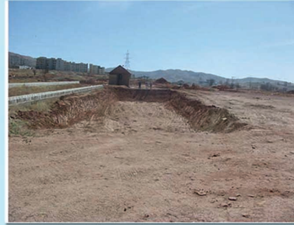
بستر کود برداری شده قبل از دادن تراکم به دیواره ها و کف