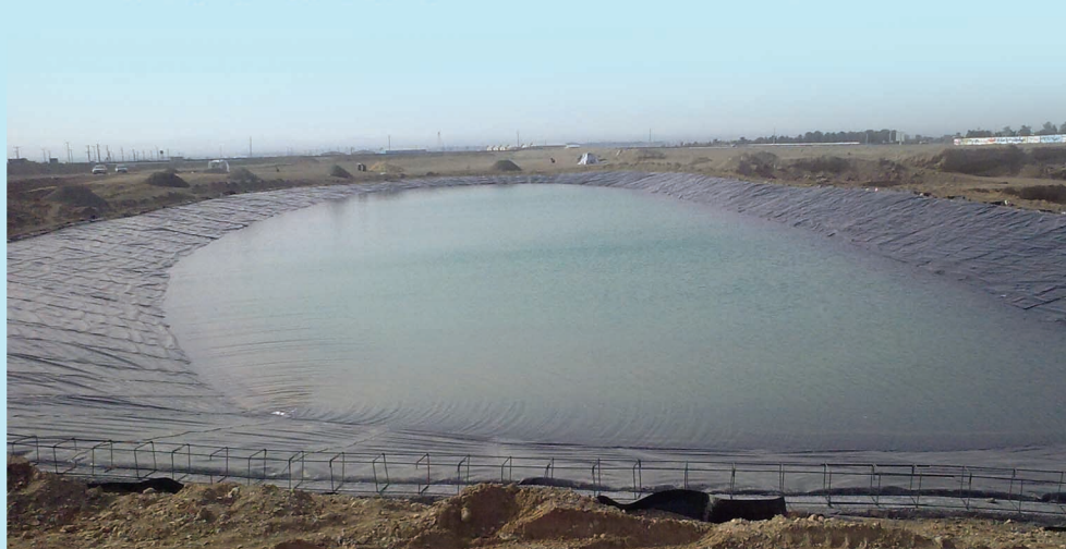
۳۰۰۰۰ متر مکعب