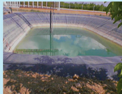
استان تهران - شهرستان ن دماوند