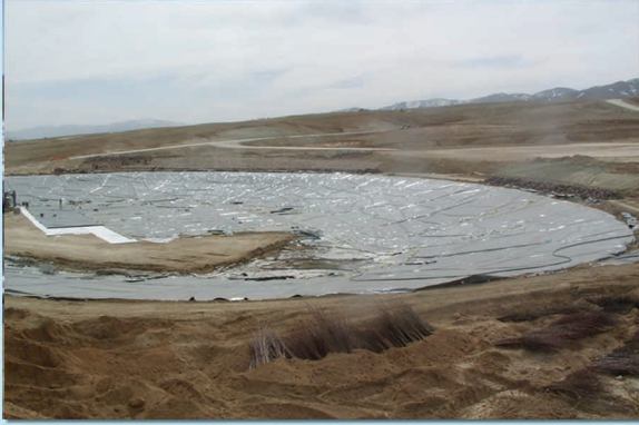
▲ دریاچه تفریحی دماوند ۷۰۰۰۰ متر مکعب