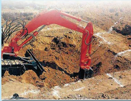
کود برداری بعد از تراز کردن سطح و کف استخر