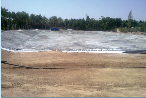
▲ دریاچه مجتمع فرهنگی و ورزشی میلاد شهرداری منطقه ۱۳