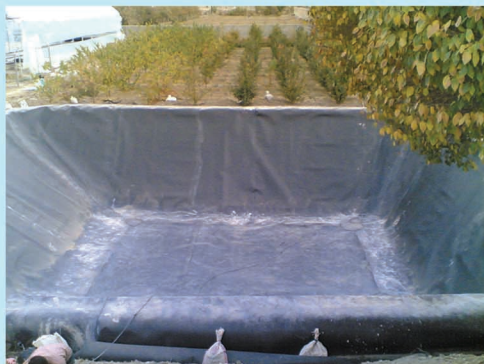
استان خوزستان - شهرستان اهواز