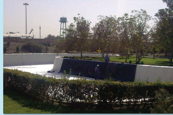
▲ دریاچه تفریحی مرکز تحقیقات جهاد کشاورزی ۲۰۰۰۰ متر مکعب