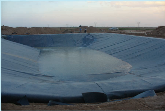
▲ استخر ذخیره آب کشاورزی شهرستان اصفهان