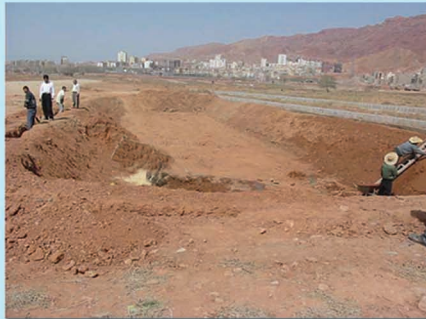
کشیدن گاه کل در مناطقی که بستر مشکل تیز گوشه یا ریزشی باشد