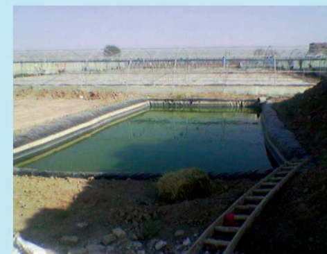
استان یزد - شهرستان اشگرد