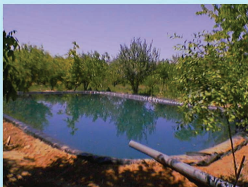
استان خراسان رضوی - فردوس