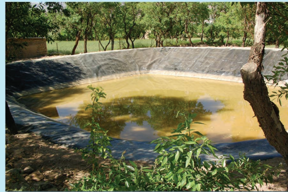
▲ استخر ذخیره آب کشاورزی ساوه