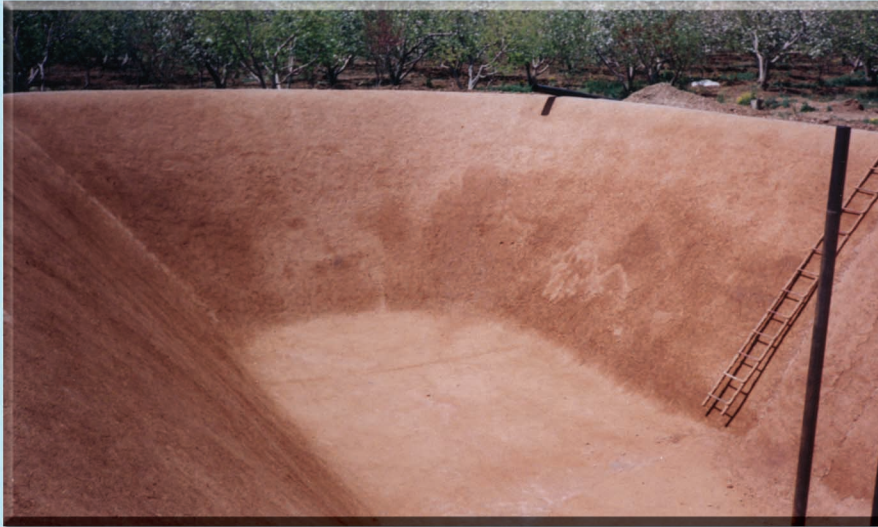
بستر آماده جهت نصب ورق پلی شیت کلیه عملیات بستر سازی بدون نیاز به هیچگونه اطلاعات فنی امکان پذیر می باشد متی شما کشاورز عزیز به راحتی قادر به ایجاد بستر مناسب برای نصب ورق می باشید .