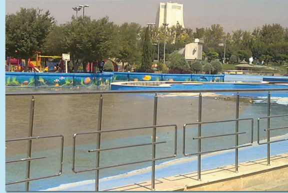
▲ دریاچه بوستان المهدی شهرداری منطقه ۹