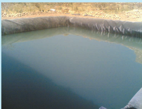
استان آذربایجان شرقی - شهرستان شبستر