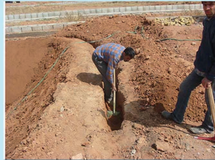
مفر تراننش، جهت مهار کردن ورق در محیط استخر