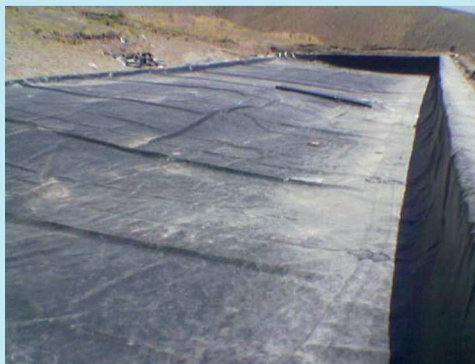
استخر ذخیره آب کشاورزی کرج - کردان