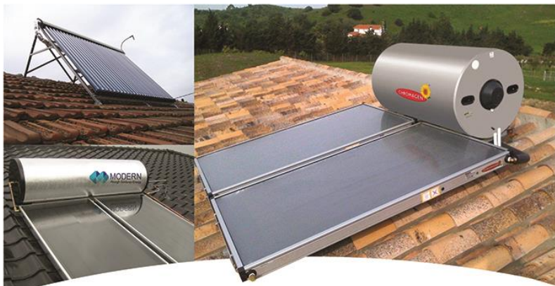
موارد کاربرد آبگرمکن های خورشیدی