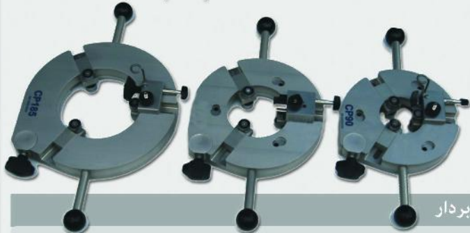
کابل لخت کن و گرافیت بردار