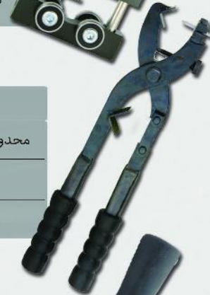
کابل لخت کن مدل BXQ-Z-40A