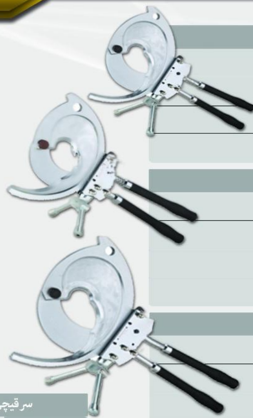
قیچی جغجغه ای دو دستی مدل : ZC-95A