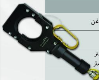
قیچی گیوتینی هیدرولیکی دستی مدل THC-20